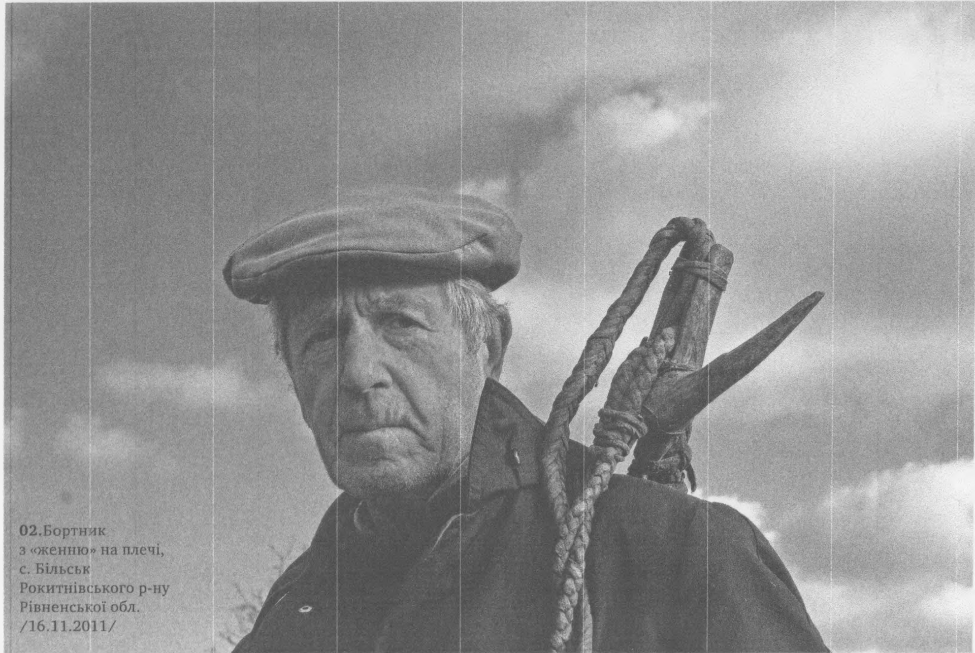
02.Бортник з «женню» на плечі, с. Більськ Рокитнівського р-ну Рівненської обл. /16.11.2011/