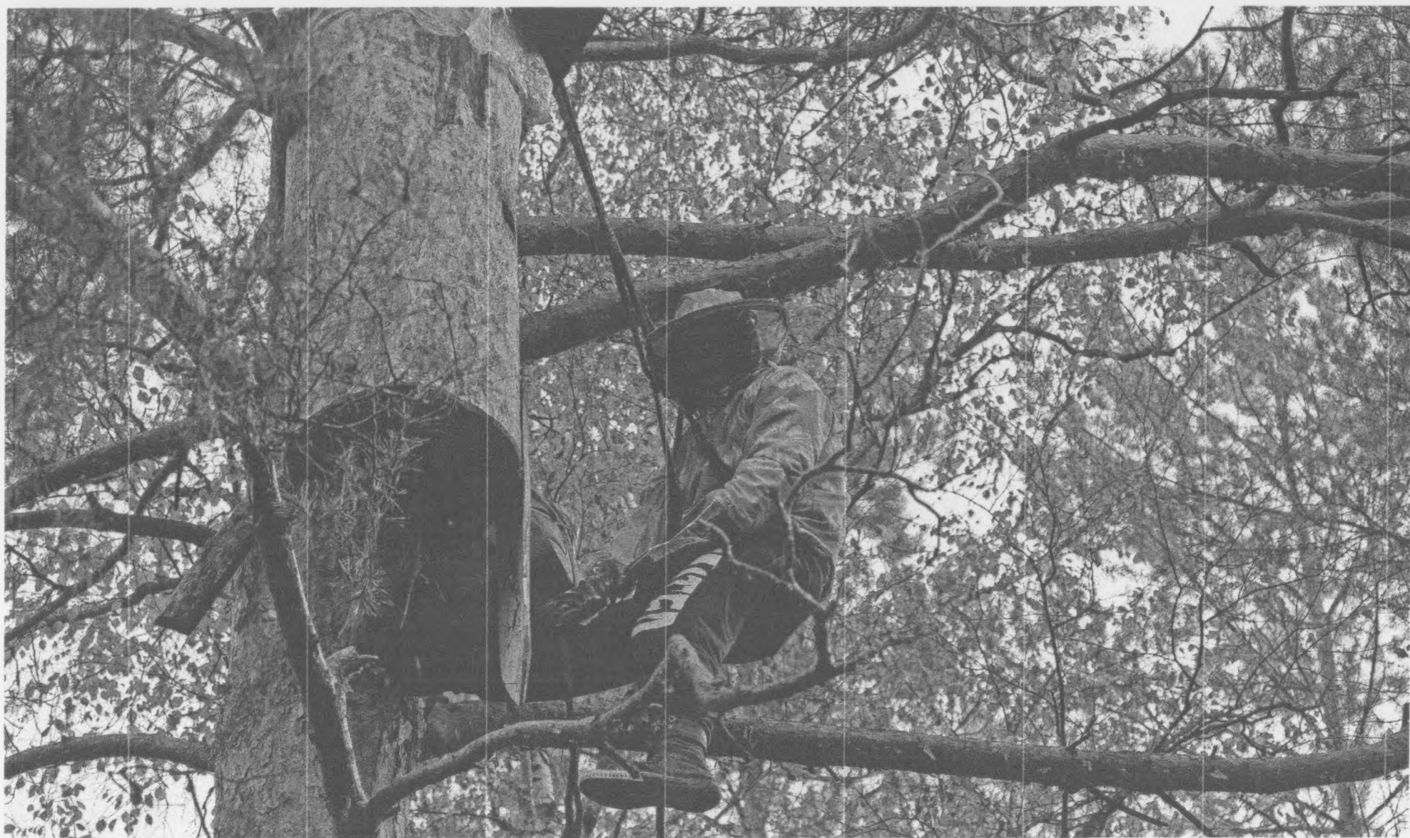
04. Бортник на «жені» під час осіннього вибирання меду з вуликів-когод, с. Купель Рокитнівського р-ну Рівненської обл. /14.10.2017/